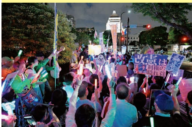
「戦争反対」「憲法守れ」とコールする人たち=5月29日、国会正門前

5月29日夜、国会前で行われた「せんそうさせない緊急アクション」には1万人が参加（主催者発表）しました。のべ3万人がオンライン視聴。国会前行動に呼応して全国150カ所以上で行動がとりくまれ、さまざまなペンライト、架空団体の旗や思い思いのグッズを持って多彩にアピールし、「戦争反対」「9条守れ」とコールしました。